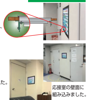
応接室の壁面に 組み込みました。